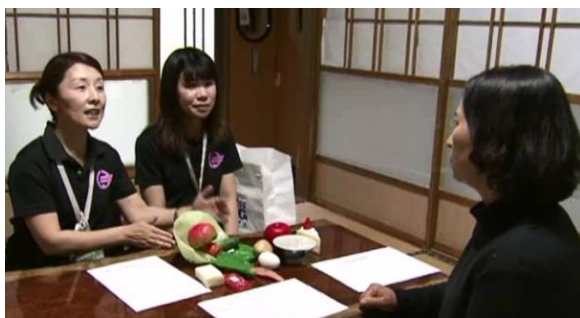
球磨村「健康守り隊」の活動を紹介するインフォーマーシャルCMの一コマ

テレビのインフォーマーシャルCMは約4分ずつ5種類9パターンを放送。そのうちのひとつでは、球磨郡球磨村が平成26年度から訪問支援事業の一環として取り組んでいる、保健師・管理栄養士・看護師による「健康守り隊」の活動を紹介した。映像は、「守り隊」の2人が家庭訪問して住民に特定健診の結果を説明し、保健指導している様子や、訪問を受けた住民が感想を話す様子を撮影したもの。「守り隊」の訪問により住民が健診結果に興味を持ち、自分の健康は自分で守ること、そのためには生活習慣の改善が重要と気付く内容で、「健診結果を説明してもらって自分の体のことがよく分かった」という住民の声を通して、見た人に特定健診・保健指導の大切さを訴えることができたのではないかと考えている。