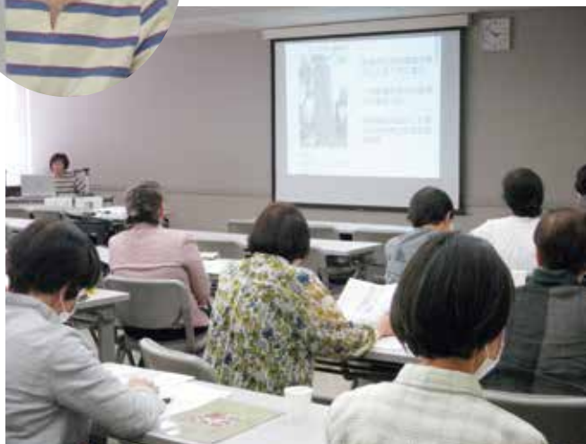
第1回研修会の様子