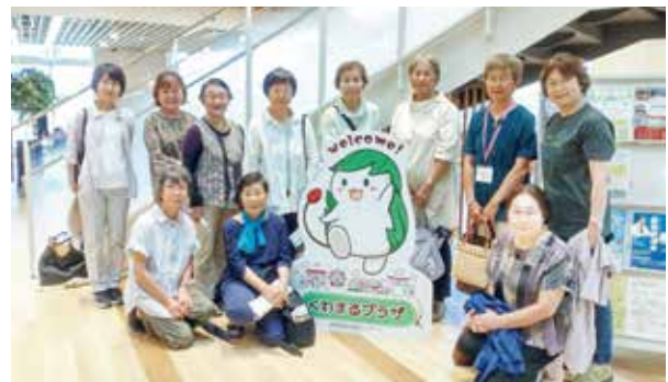
くわまるプラザにて

1階には、成人検診室兼会議室、調理室等もあり災害時などは指定避難所としても機能できるように工夫されていました。2階は、総合カウンター、乳幼児健診エリア、こども家庭センター窓口、3階はプレイルーム、託児室、親子カウンター等があり、母子健康手帳の交付から妊娠・出産・育児に関する包括的な相談が受けられるとのことでした。部屋によっては、住民への貸館も行っており、年代を超えて広く利用してもらえる体制がとられていました。施設見学後、現役時代を振り返りながら交流が深まりました。