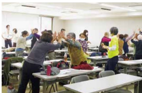
第2回研修会の様子