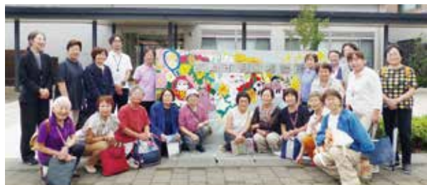
高崎市児童相談所正面玄関にて

ーカーがタブレットを持って迅速に現場に着くとすでに初期情報が入力され、画像も共有されるため、児相所長等是对応の決定がすぐにできます。いつでもどこでも入力可能な環境で共有されています。初期対応が徹底され、支援会議での処遇も地域と連携を取り、子供中心で子供の力を最大限発揮させる検討がなされます。高崎市独自の取組みに大いに期待し子供達が幸せに育ってほしいです。