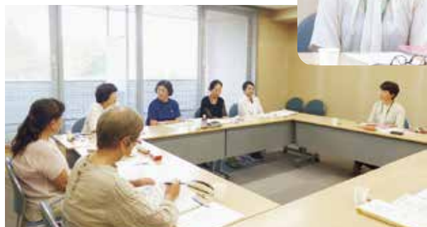
第2回災害支援ボランティア実施要綱 検討委員会の様子