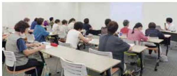
高崎市児童相談所内で聴講の様子

全国的にも数少ない中核市が設置する児童相談所について、本格稼働前の施設内を見学し、地域との連携体制等を学びました。