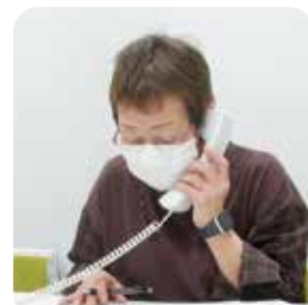
利用勧奨当日の様子