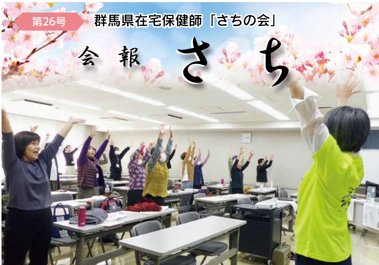
第2回研修会「笑いヨガ」受講の様子