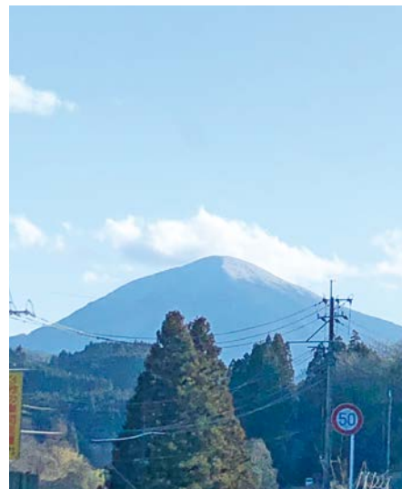
【訪問の帰りで出会う「涌蓋山」】 九重町と小国町にまたがる標高1,500mの山 大分県側では「玖珠富士」、熊本県側では 「小国富士」として親しまれています！

この訪問を通して、現職の時はこの対象者の親世代にアプローチしていたこと、若い世代の声をじっくり・ゆっくり聴くことがなかったなあと、改めて背筋を伸ばしました。自分自身の活動を振り返る、とても良い機会をいただきました。