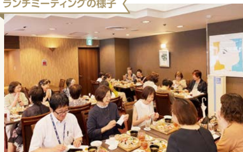
ランチミーティングの様子