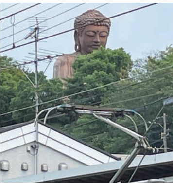
東海市聚楽園の大仏 静かに東海市民を見守っている。

交流会の主催は「気軽に」お茶飲み交流会「実行委員会」で、当日は六世帯七名の参加者が来られていました。被災者の方々、コープあいち尾張南ブロックの方、「絆カフェ」の方、東海市社協、臨床心理士、多文化SW、日本福祉大学の学生さん、「笑いヨガ」の先生、VCなごや、支援センターの職員、ボランティア等多職種に参加が