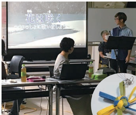
元学生ボランティアによる オーボエ演奏

「花は咲く」「風ふえ」の演奏に心安らぎ、オーボエの伴奏で全員が「花は咲く」を歌いました。しみじみとした歌声でした。