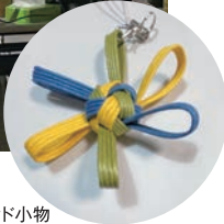
クラフトバンド小物

昼食はボランティアさんたちによるふるさとの懐かしい料理の「冬瓜の汁物」。具だくさんの温かい汁物に、ほっこりしました。