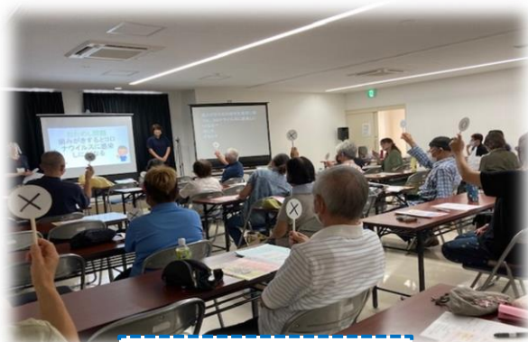
大村市支援の様子