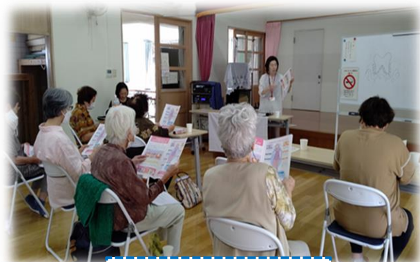
長崎市支援の様子