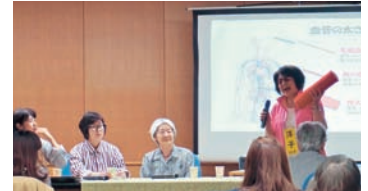
あなたの血管、元気？

○テーマⅠでは、在宅保健師に活動協力を依頼している保健事業の他、保健事業係が取り組んでいる事業や県との連携強化などについて説明がありました。健康劇では、いちょう座の皆さんによる熱演がとても好評でした。テーマⅡでは、平成30年度より開始する特定健診・保健指導の運用の見直しについて要点の解説がありました。