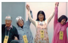
あなたの血管、元気？ (都筑区)