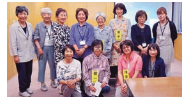
いちょう座の皆さん