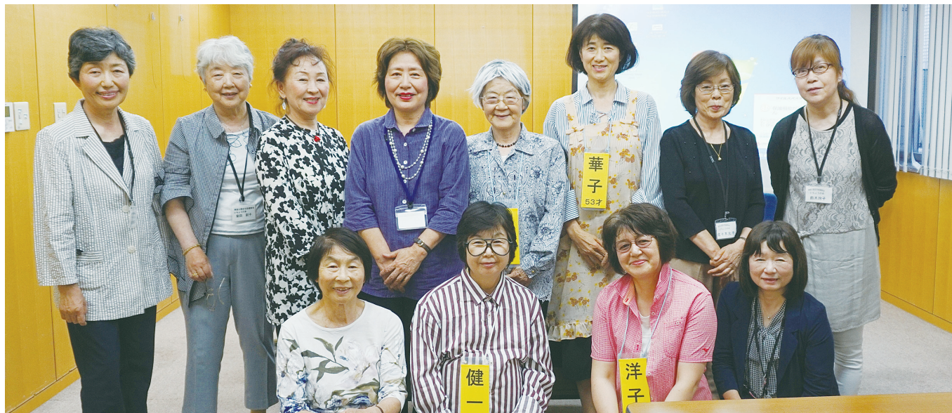
平成30年5月30日(水) 研修会にて健康劇を上演した「いちょう座」のメンバー